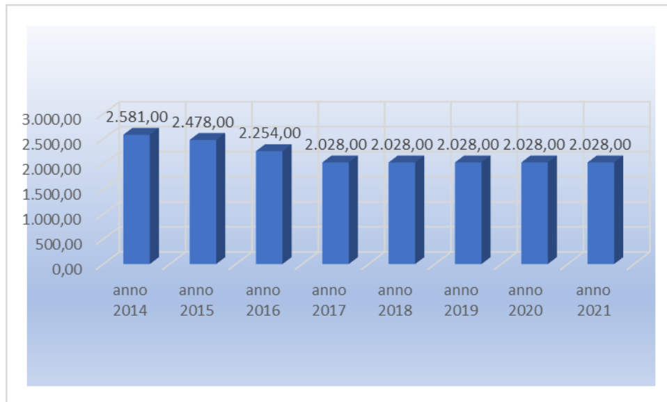
CONTRIBUTO TECNOBORSA S.C.P.A PERIODO 2014-2021

Dal bilancio 2020 si rileva un aumento del valore della produzione rispetto all'esercizio 2019, ciò ha comportato la realizzazione di un risultato d'esercizio positivo (4.408) a fronte della perdita (-91.963) registrata nel corso dell'esercizio 2019.