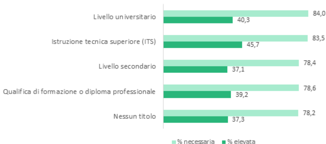
FIGURA 1 – Competenze green richieste per livello di istruzione nel 2020 (% sul totale entrate)