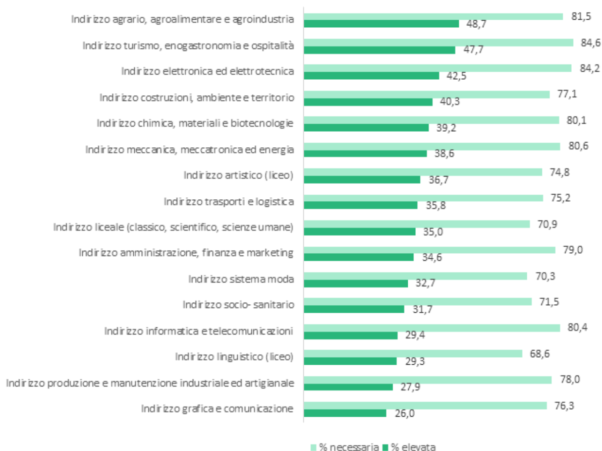
FIGURA 3 – Competenze green richieste agli indirizzi di livello secondario nel 2020 (% sul totale entrate)